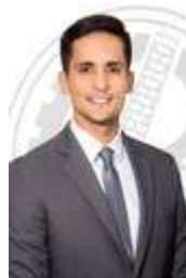
VEREADOR THIAGO RODRIGUES – PSC