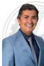
VEREADOR PAULO RONILDO – PL